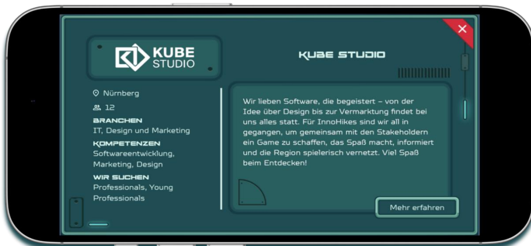
Abb. 2: Beispiel eines Steckbriefs