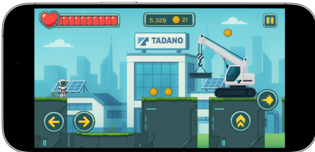
Abb. 6: Beispielhafte Darstellung eines eigenen Levels im CI-Design eines Unternehmens im All-in-Paket