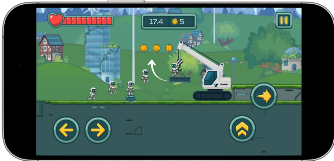
Abb. 5: Beispielhafte Darstellung eines animierten personalisierten Assets (Kran) im Premium-Paket