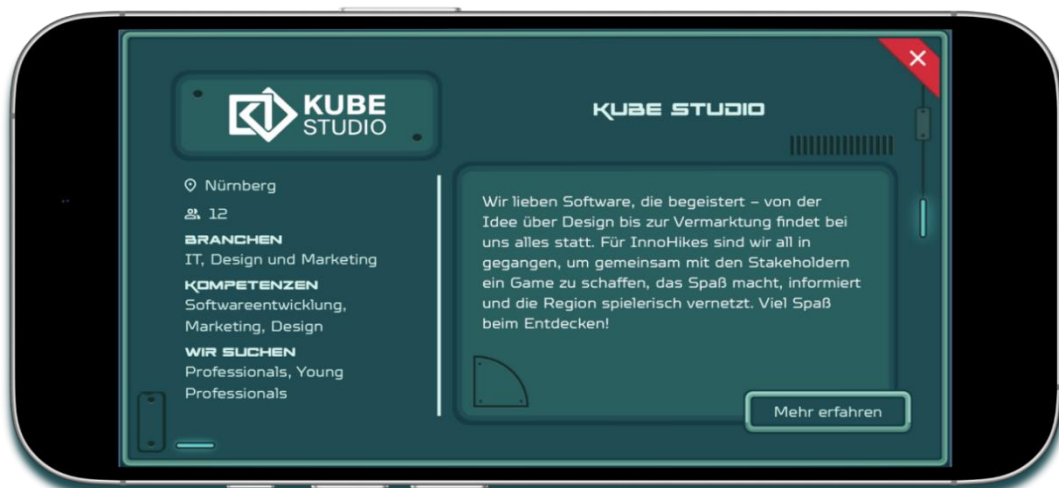
Abb. 2: Beispiel eines Steckbriefs