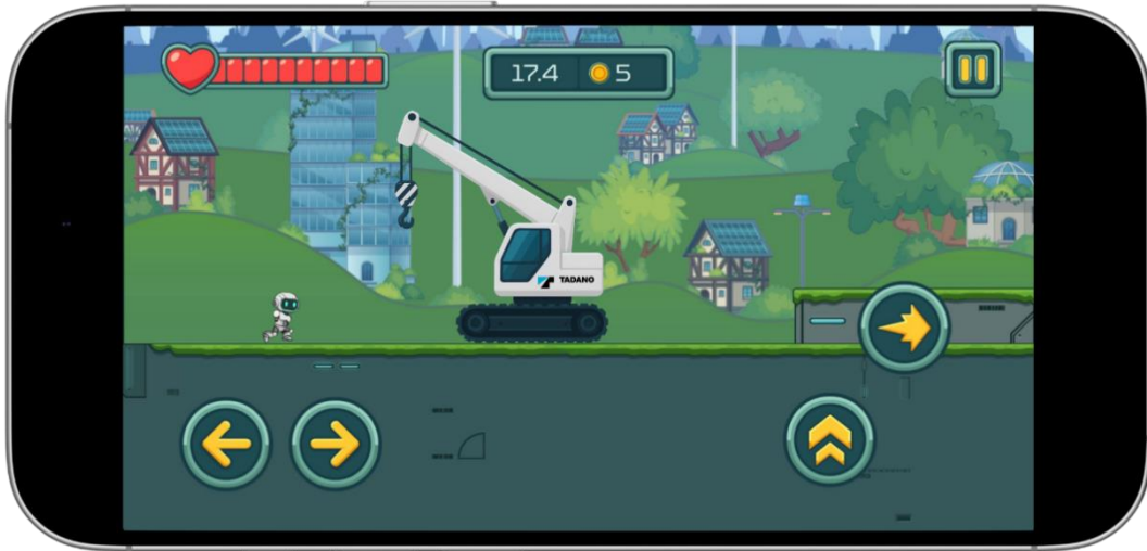
Abb. 3: Beispielhafte Darstellung eines statischen personalisierten Assets (Kran) im Plus-Paket